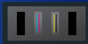
Gamme SG2 (2 têtes)