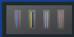
Gamme VG2 (4 têtes)

Les têtes d'impression Roland DG FlexFire optimisent les performances d'impression de sorte que même le mode le plus rapide permet d'obtenir des gris neutres, des couleurs vives et des tons de peau lisse.